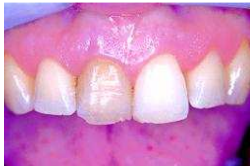
Verkleuring door een dode tand