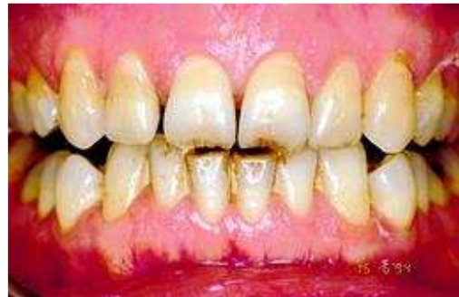
Verkleuring door verouderingsproces