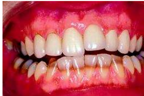
Verkleuring door ontwikkelingsstoornissen in de tandkiem