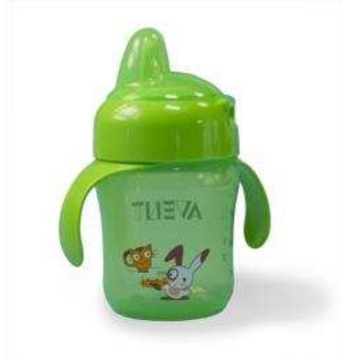
Laat uw kind vanaf 9 maanden uit een beker drinken

Zuigen is een natuurlijke, instinctmatige behoefte van een baby. Kinderen zuigen graag op hun duim of op een speen. Meestal levert dit geen problemen op voor het melkgebit. Pas als de eerste snijtanden van het blijvend gebit doorbreken, kan duimen schadelijk zijn. Dan kan uw kind de boventanden van het blijvend gebit en de kaak naar voren duwen. Als uw kind gaat duimen, kunt u het beter een speen geven. Een speen kunt u natuurlijk gemakkelijk weghalen. Een kind stopt