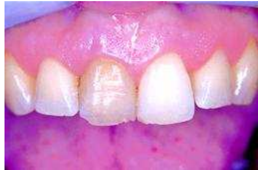
Verkleuring door een dode tand

goed beschermd tegen de blekende stof (peroxide). U krijgt de bleeklepel en de gel met de blekende werking mee naar huis. Daarom wordt dit ook wel 'thuisbleken' genoemd. Uw tandarts geeft aan hoe lang u de bleeklepel met de gel moet dragen voor het gewenste resultaat. Meestal zult u de bleeklepel 's nachts dragen. Afhankelijk van de verkleuring ziet u na enkele dagen of weken resultaat. Tijdens het bleken, kunnen uw tanden en tandvlees tijdelijk gevoelig worden. Raadpleeg uw tandarts als deze klacht optreedt.