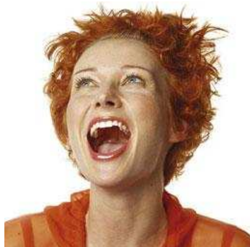
Het bleekresultaat verschilt voor iedereen

Het bleekresultaat verschilt voor iedereen. De basiskleur van uw tanden bepaalt voor een belangrijk deel het uiteindelijke resultaat. En die basiskleur is bij iedereen anders. Het bleekresultaat is soms niet blijvend. In een aantal gevallen komt de verkleuring na een paar jaar weer terug. De vorming van tandbeent gaat namelijk gewoon door. Ook gebleekte tanden zullen, net zoals niet-gebleekte tanden, op den duur verkleuren door veroudering. Dit proces gaat sneller als u rookt of bepaalde voedingsstoffen veel gebruikt. Het effect van langdurig of herhaald bleken op het tandweefsel is niet helemaal bekend.