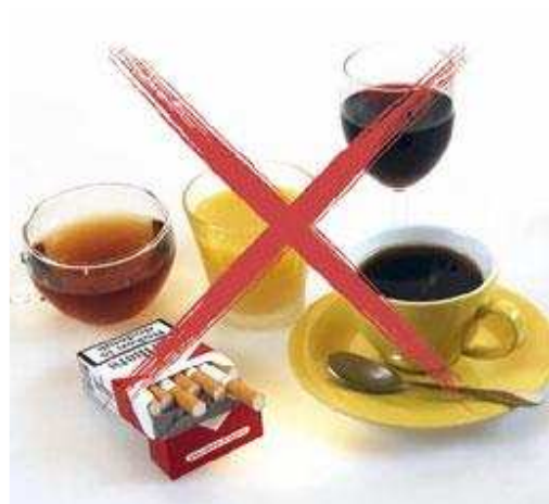
Tijdens de behandeling met de bleeklepel is het gebruik van deze producten af te raden

Door het bleken, wordt het glazuur van de tanden en kiezen iets poreuzer. Dat is tijdelijk. Het glazuur herstelt zich weer. Tijdens de behandeling met de bleeklepel kunnen bepaalde etenswaren en dranken het resultaat nadelig beïnvloeden. Voorbeelden daarvan zijn koffie, thee, rode wijn, koolzuurhoudende frisdranken, citrusvruchtensap en kleurstof bevattende etenswaren (zoals vruchtenjam). Tijdens de behandeling is het gebruik van deze producten, evenals roken, af te raden.