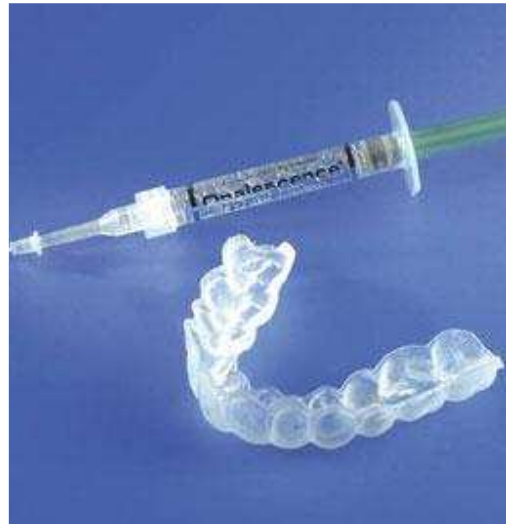
Van de tandarts of mondhygiënist krijgt u de doorzichtige bleeklepel en de gel met de blekende werking mee naar huis

Hierop maakt de tandtechnicus in het tandtechnisch laboratorium een bleeklepel. Deze wordt gemaakt van een zachte kunststof, specifiek voor uw gebit. Dat is belangrijk, want dan past de lepel goed en wordt uw tandvlees