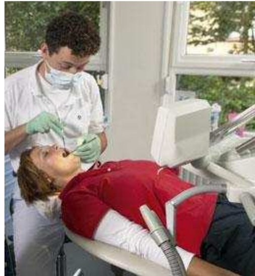
Laat uw gebit controleren door uw tandarts of mondhygiënist voordat u besluit uw tanden te bleken

Laat uw tandarts of mondhygiënist eerst uw gebit bekijken en beoordelen. Die moet vaststellen dat uw tanden gezond en vrij van gaatjes zijn en dat uw vullingen niet lekken. Daarna wordt de huidige kleur van uw tanden beoordeeld. Wat is de oorzaak van de verkleuring? Zijn er veel donkere vullingen in uw mond? Heeft u veel kronen en bruggen? Zijn ziekten of medicijnen de oorzaak? Zijn uw tanden goed schoon? Welke kleur zou goed bij u passen? Bleken is niet altijd de enige of beste oplossing. Uw tandarts of mondhygiënist zal beoordelen of bleken voor u zinvol is en of u het gewenste resultaat zult bereiken. Verkleuringen als gevolg van ziekten en medicijnen vragen vaak om een speciale behandeling. Raadpleeg hiervoor uw tandarts.