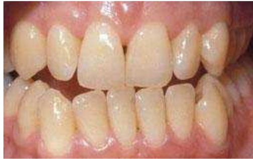
Voor het bleken