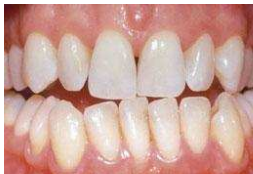
Resultaat na tien dagen bleken met de thuisbleekmethode onder begeleiding van de tandarts

De lengte van een bleekbehandeling hangt af van de bleekmethode. Bij de thuisbleekmethode duurt het meestal twee weken voordat u een gewenst resultaat bereikt.